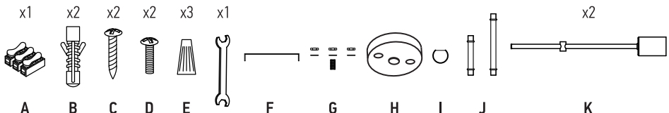
– Рис. 1. Схема подключения LOFT EASY-2E27-BL, LOFT EASY-2E27-BLT